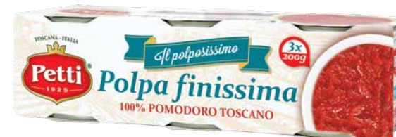
3x200g / 2x200g