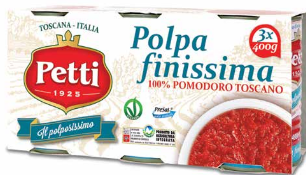
3x400g / 2x400g