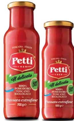
Il delicato Bio

Passata extrafine biologica Organic extra fine sieved tomatoes Purée extrafine de tomates biologiques