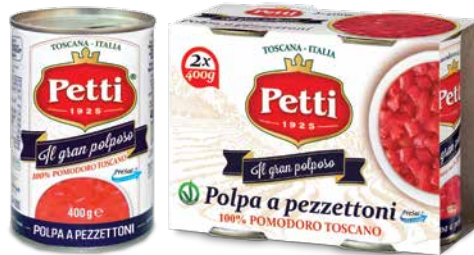
Il gran poloso

Polpa a pezzettoni Chopped tomatoes Tomates pelées concassées