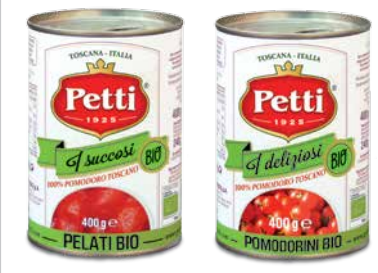
I succosi Bio

Pomodori ciliegini biologici Organic cherry tomatoes Tomates cerises biologiques