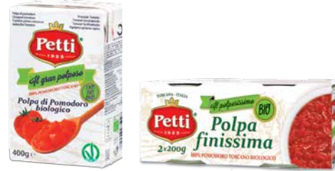
Il gran poloso Bio e Il polpossissimo Bio

Polpa di pomodoro biologica Organic chopped tomatoes Tomates pelées concassées biologiques