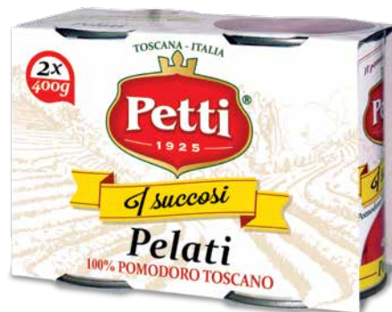
3x400g / 2x400g