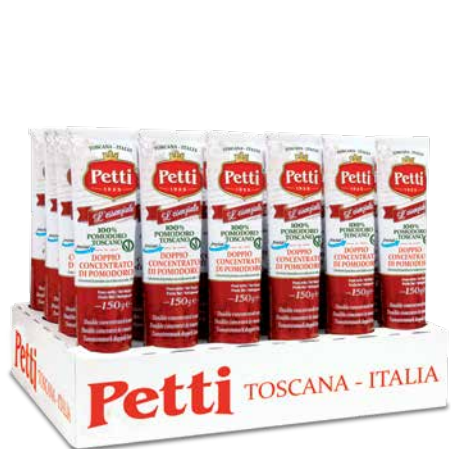
24x200g / 24x150g / 24x130g