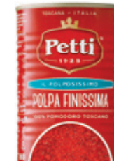
400g / 200g