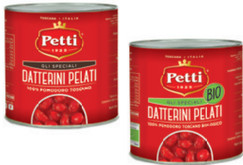
GLI SPECIALI E GLI SPECIALI BIO

Datterini pelati Peeled datterini tomatoes Tomates dattes pelées