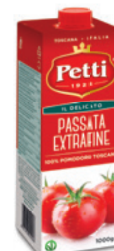
1000g / 500g