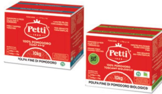
IL POLPOSISSIMO E IL POLPOSISSIMO BIO

Polpa fine di pomodoro Finely chopped tomatoes Tomates pelées concassées fines