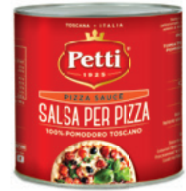
FLAVOURED PIZZA SAUCE

Salsa di pomodoro per pizza Pizza tomato sauce Sauce tomate pour pizza