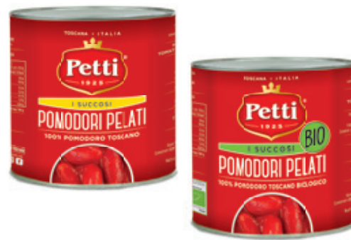
I SUCCOSI E I SUCCOSI BIO

Pomodori pelati Peeled tomatoes Tomates pelées