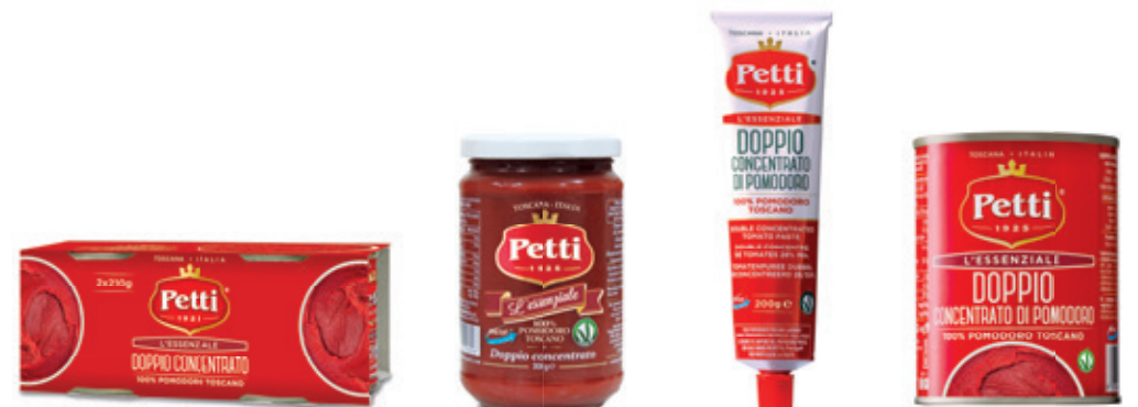
2x210g / 210g