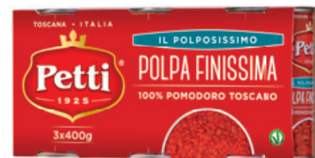
3x400g / 2x400g / 3x200g / 2x200g

Egalement disponible en version biologique.