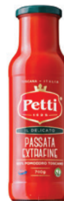
700g / 500g / 350g

Egalement disponible en version biologique.