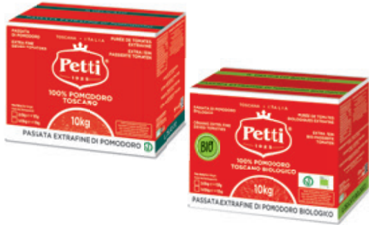
IL DELICATO E IL DELICATO BIO

Passata extrafine di pomodoro Extra fine sieved passata Purée de tomates extrafine