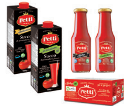
DELICATISSIMO DELICATISSIMO BIO

Succo di pomodoro fresco Fresh tomato juice Jus de tomate fraîche