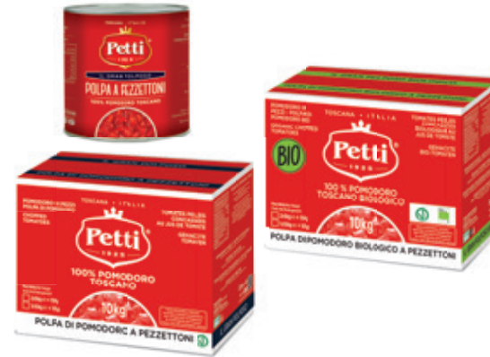
IL GRAN POLPOSO E IL GRAN POLPOSO BIO

Polpa di pomodoro a pezzettoni Chopped tomatoes Tomates pelées concassées