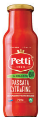
700g / 500g