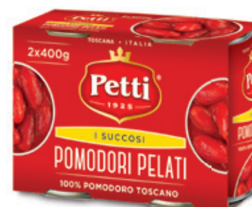
3x400g / 2x400g